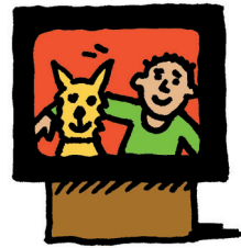
shows for children