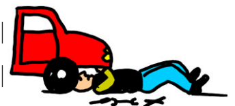
a car mechanic.