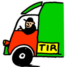
a truck driver.