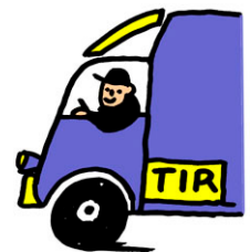
a truck driver.