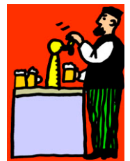
a pub keeper.