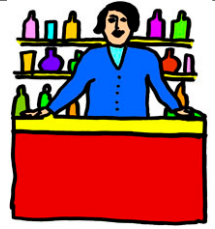
a shop assistant.